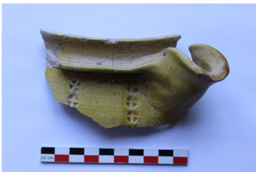
Fig. 4 : Cruche à collerette glaçurée.