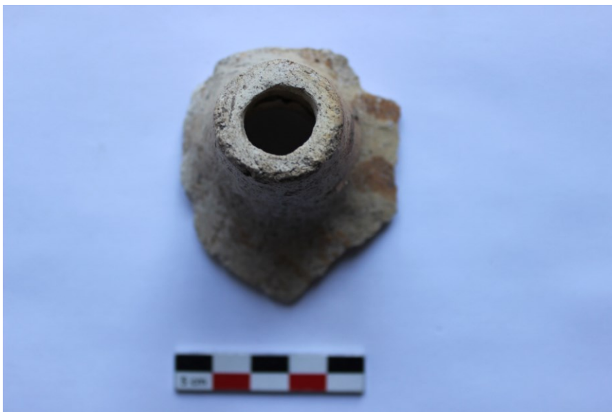
Fig. 2 : Bec tubulaire peint, vue de face.