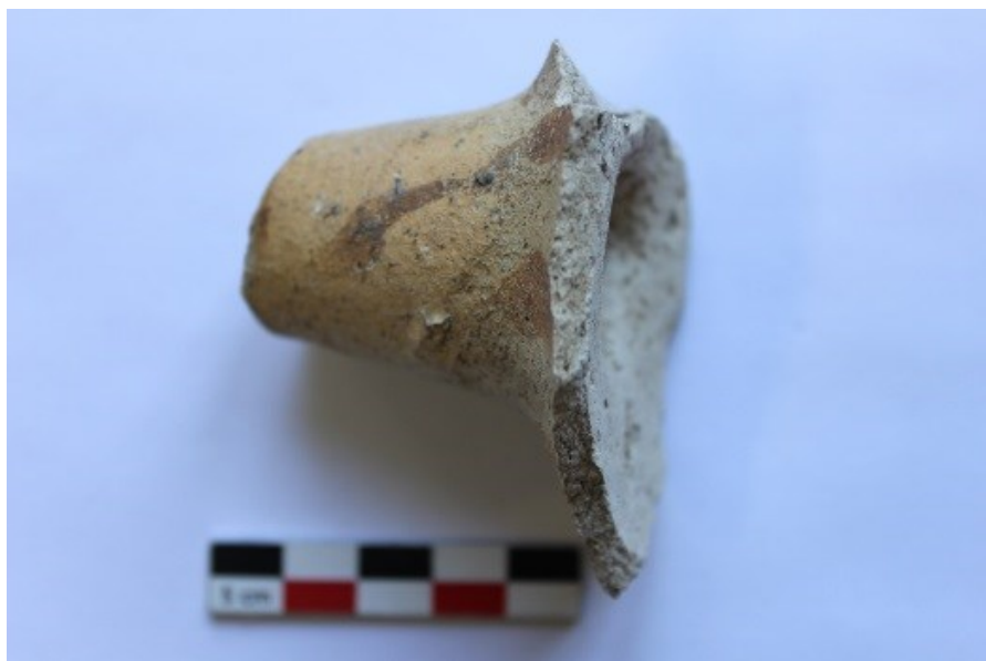
Fig. 3 : Bec tubulaire peint, vue de profil.